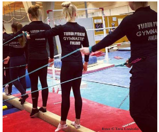
Turun Pyrkivä Gymnastics Naisten telinevoimistelun joukkue-SM pronssia (joukkueella, jossa kaikki alle 17-vuotiaita!)