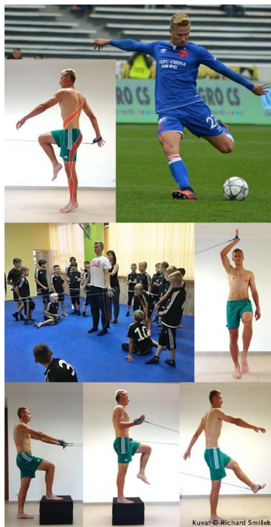
Antonin Barak Udinese, Serie A, Italia